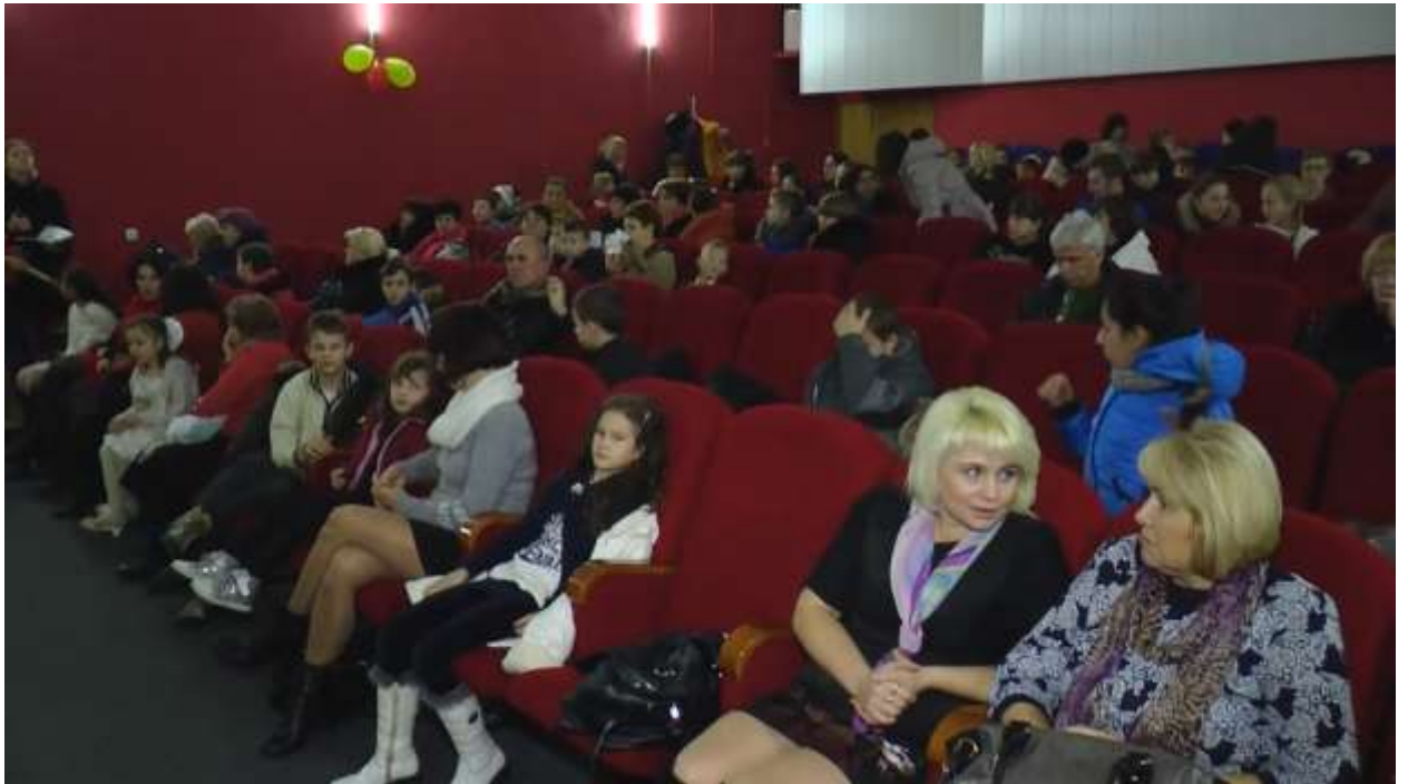
Участники открытия проекта и зрители