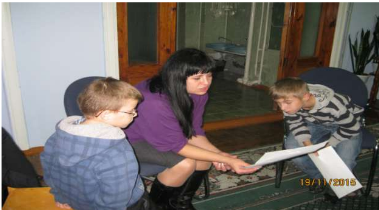
Групповой психологический тренинг с воспитанниками ДДСТ