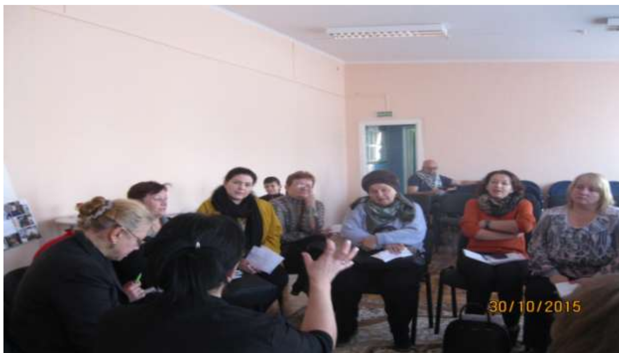
Обсуждение проекта "Книга жизни" на заседании клуба "Под родительским кровом"