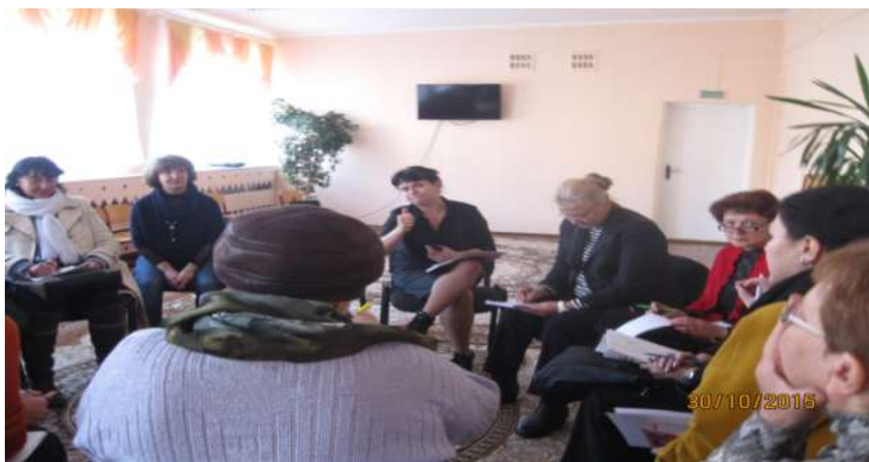
Обсуждение проекта "Книга жизни" на заседании клуба "Под родительским кровом"