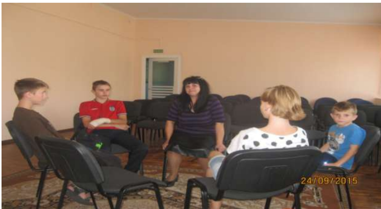
Тренинг личностного роста с воспитанниками ДДСТ