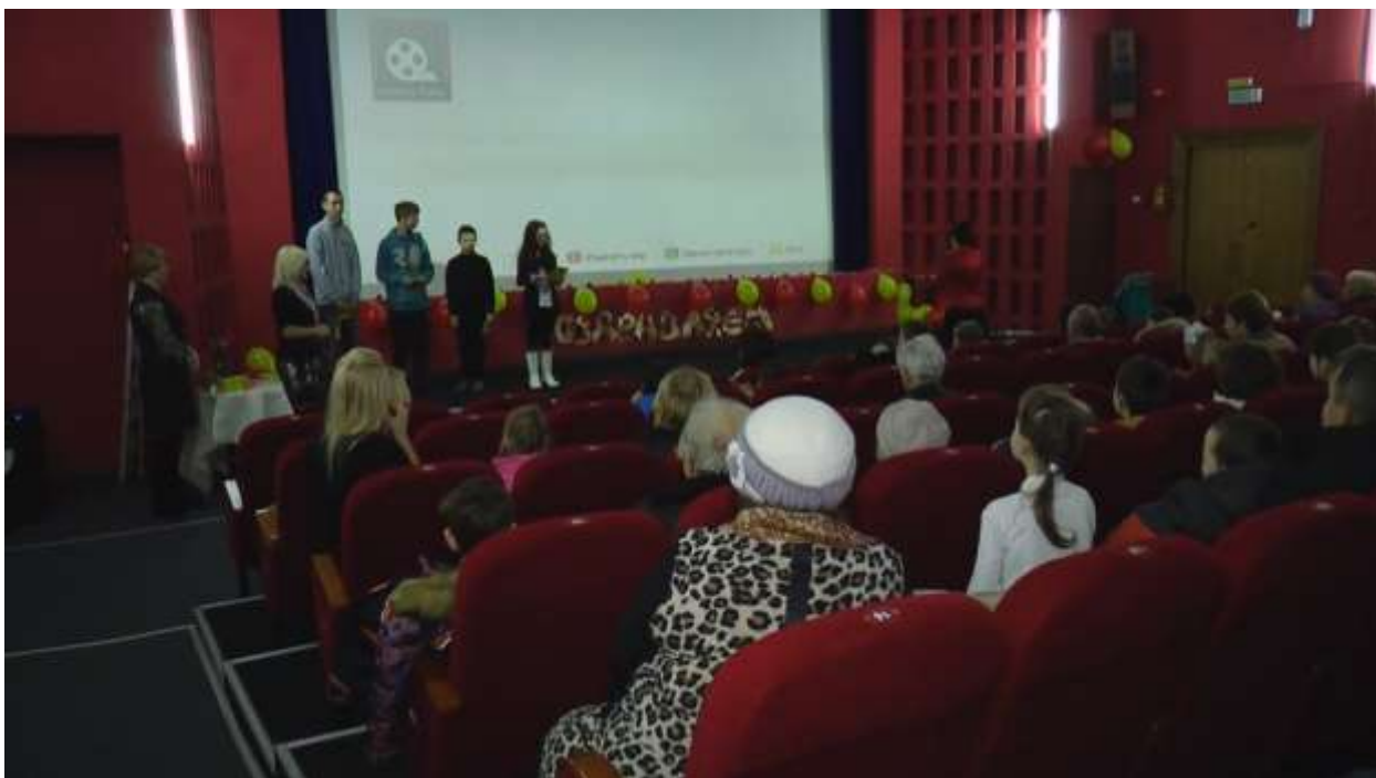
Открытие проекта "Ступени триумфа". На сцене - именинники ноября.