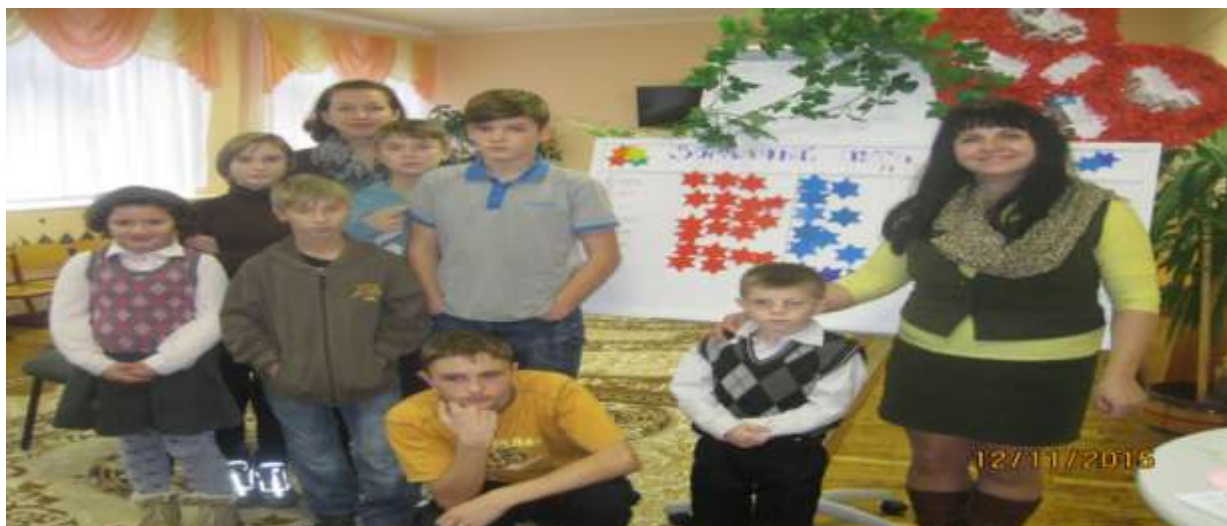
Итоги распределения звёзд