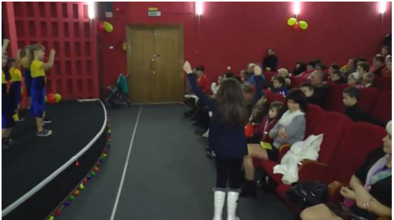
Выступление танцевальной группы "A.S.-Dance"