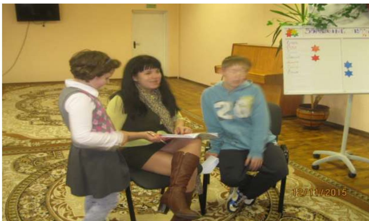
Работа по обсуждению итогов недели